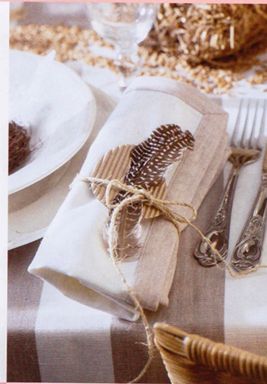
Kleine Ursachen, wie Federn, Getreidekörner und einfache Paketschnur zeigen große Wirkung. Inge Ofenstein wird für die Frühjahrsausgabe der beststyle wieder Ostertische fotografieren.