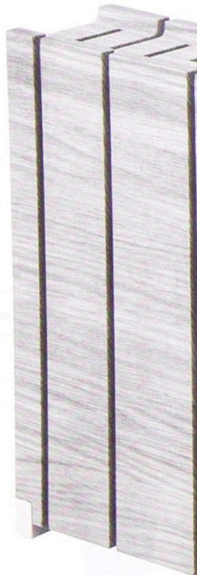
Messerblock 1012 26 x 19,5 x 8 cm