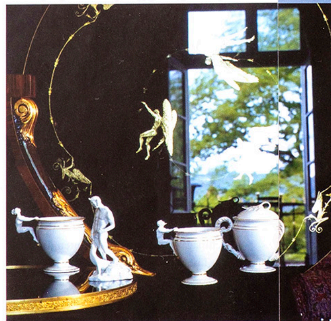
Mit Liebe zum Detail setzt die Fotografin Tische ins rechte Licht.