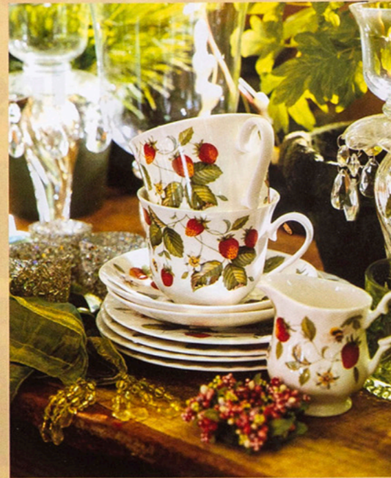
Tischkultur ist Inge Ofenstein ein persönliches Anliegen. Mit Liebe zum Detail inszeniert sie ein gemütliches Zuhause.